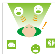
【ウルトラズーム有り】