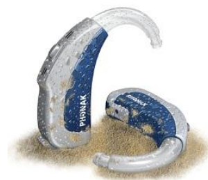
＜ハウジングカラー＞ オーシャンブルー(G3)