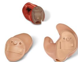
サウンドリカバーが搭載されたフォナック ダリアの CIC、カナル、フルシェル

この価格帯の耳あな型で、初めてサウンドリカバーが搭載されたことによって、より多くの方にスパイスによる恩恵に加えてサウンドリカバーでの聞き取り改善もご提供できるようになりました。