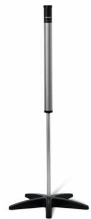
線音源スピーカー デジマスター5000